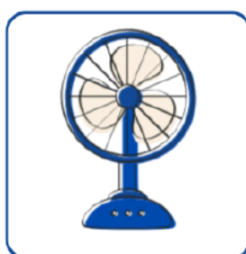
Utilisez des ventilateurs