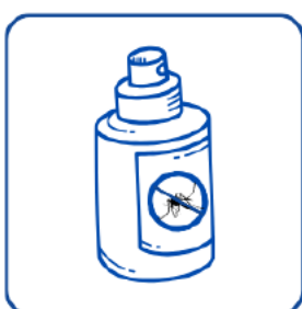
Appliquez des répulsifs cutanés