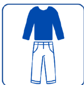
Portez des vêtements amples et couvrants