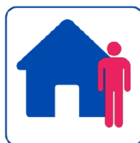
Limitez vos déplacements